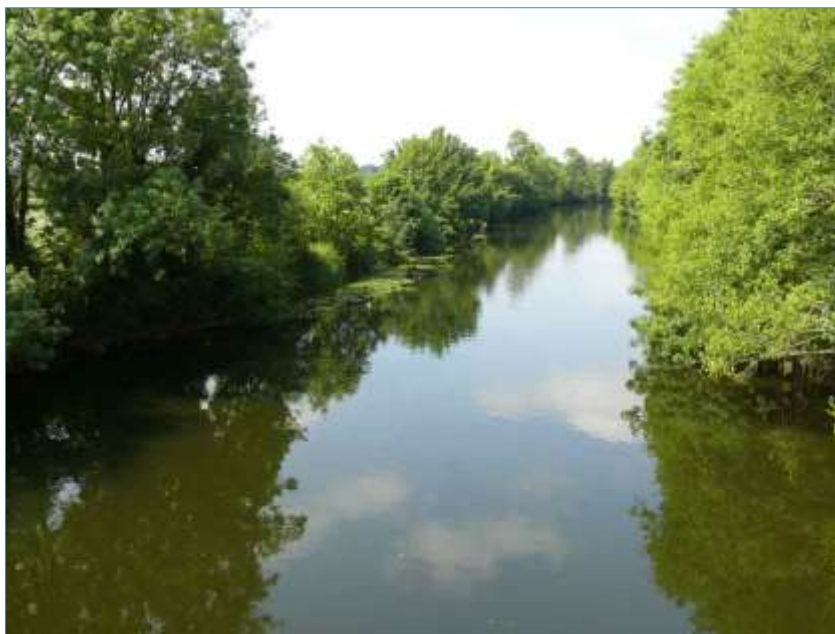
La Vendée en aval de Fontenay-le-Comte.