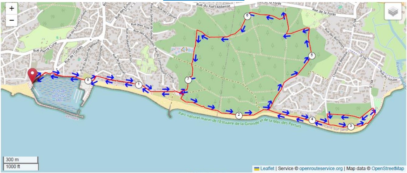
JARD SUR MER [ 8531.7 m - 8.53 km ]